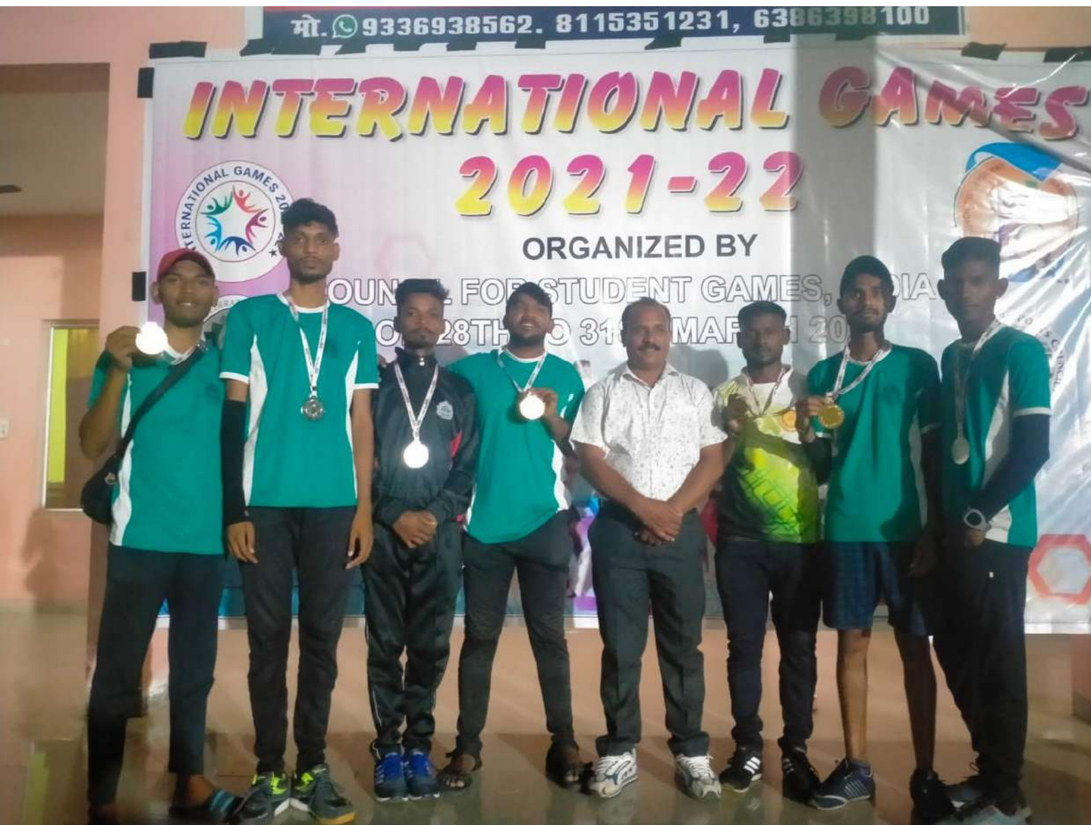
COLLEGE STUDENT IN PARTICIPATED IN INTERNATIONAL VARANSI ( U.P) 2021-22