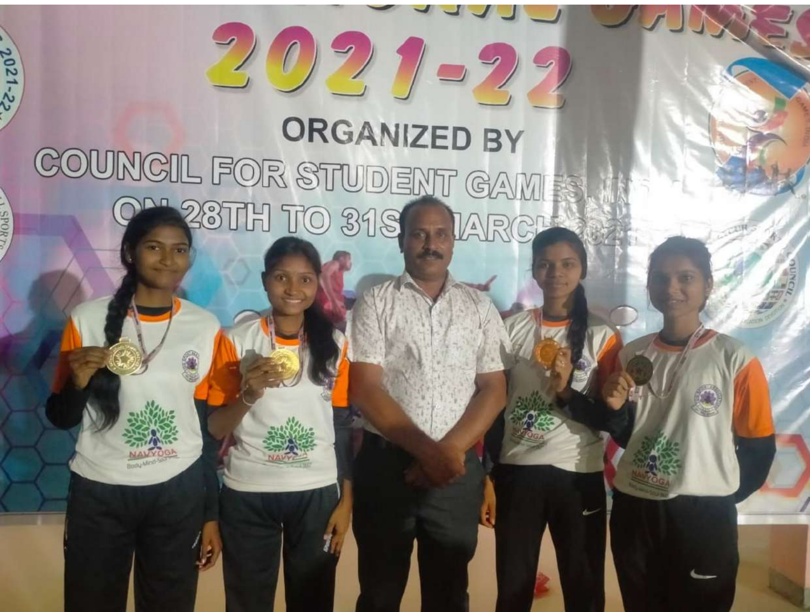
COLLEGE STUDENT IN PARTICIPATED IN INTERNATIONAL VARANSI ( U.P) 2021-22