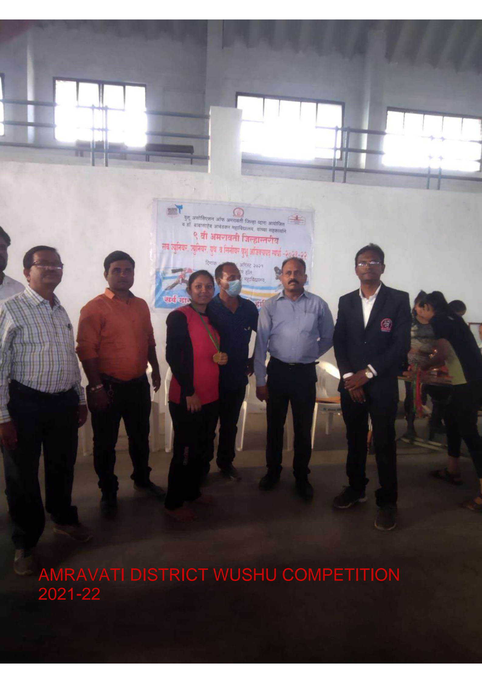
AMRAVATI DISTRICT WUSHU COMPETITION 2021-22