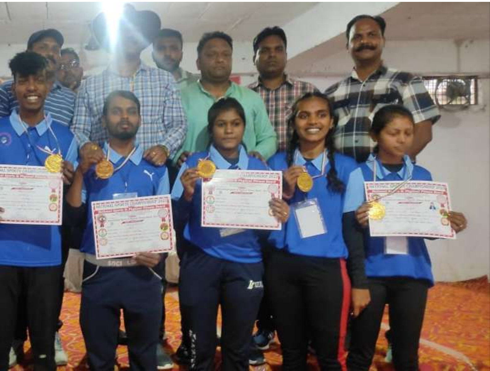
COLLEGE STUDENT IN PARTICIPATED IN NATIONAL PANIPAT ( HARIYANA) 2022-23