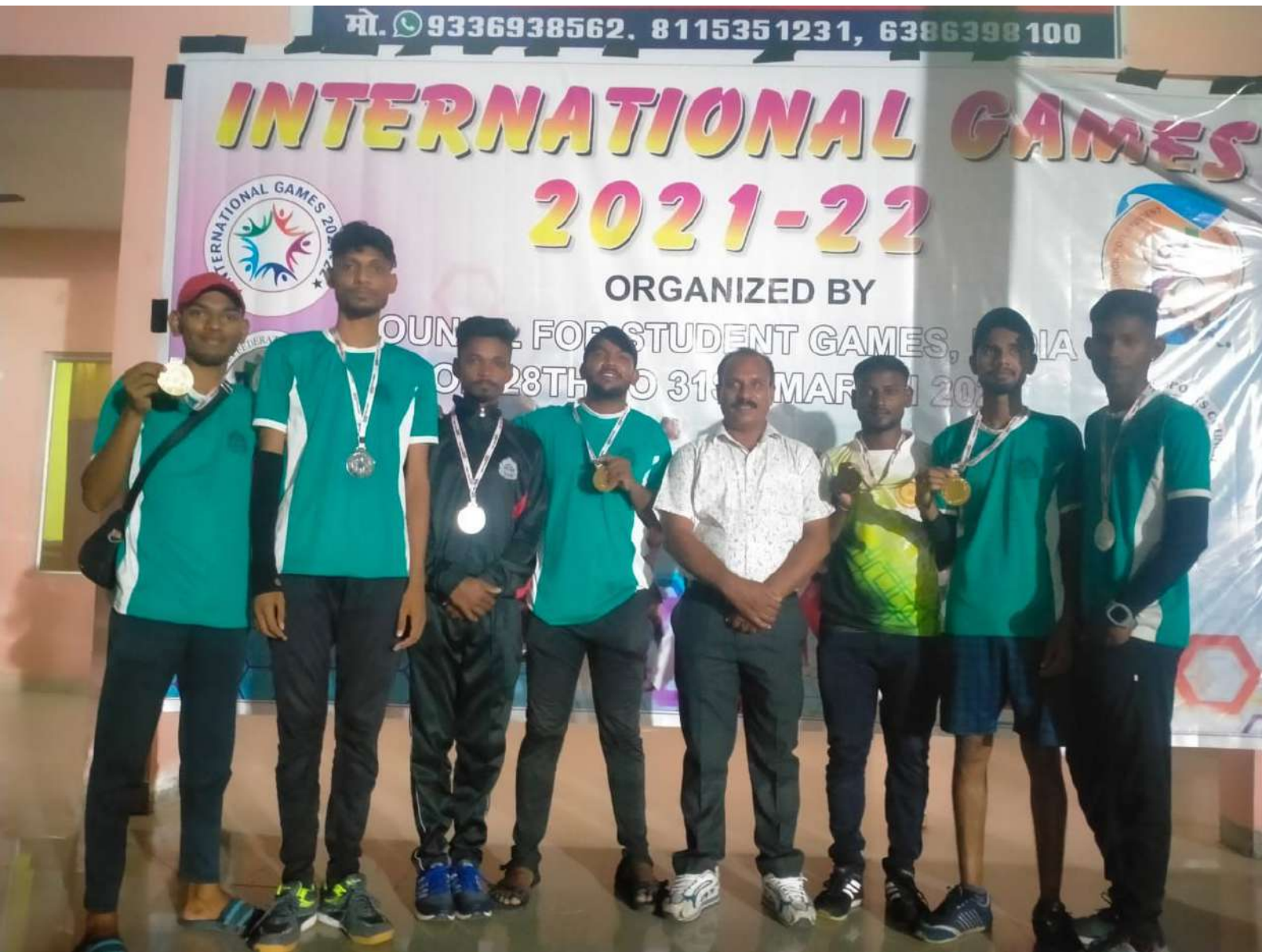
COLLEGE STUDENT IN PARTICIPATED IN INTERNATIONAL VARANSI ( U.P) 2021-22