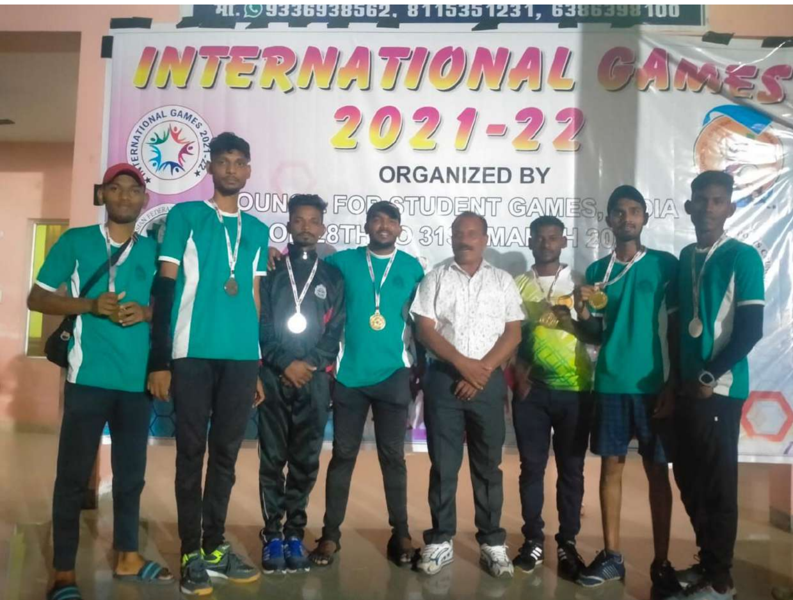
COLLEGE STUDENT IN PARTICIPATED IN INTERNATIONAL VARANSI ( U.P) 2021-22