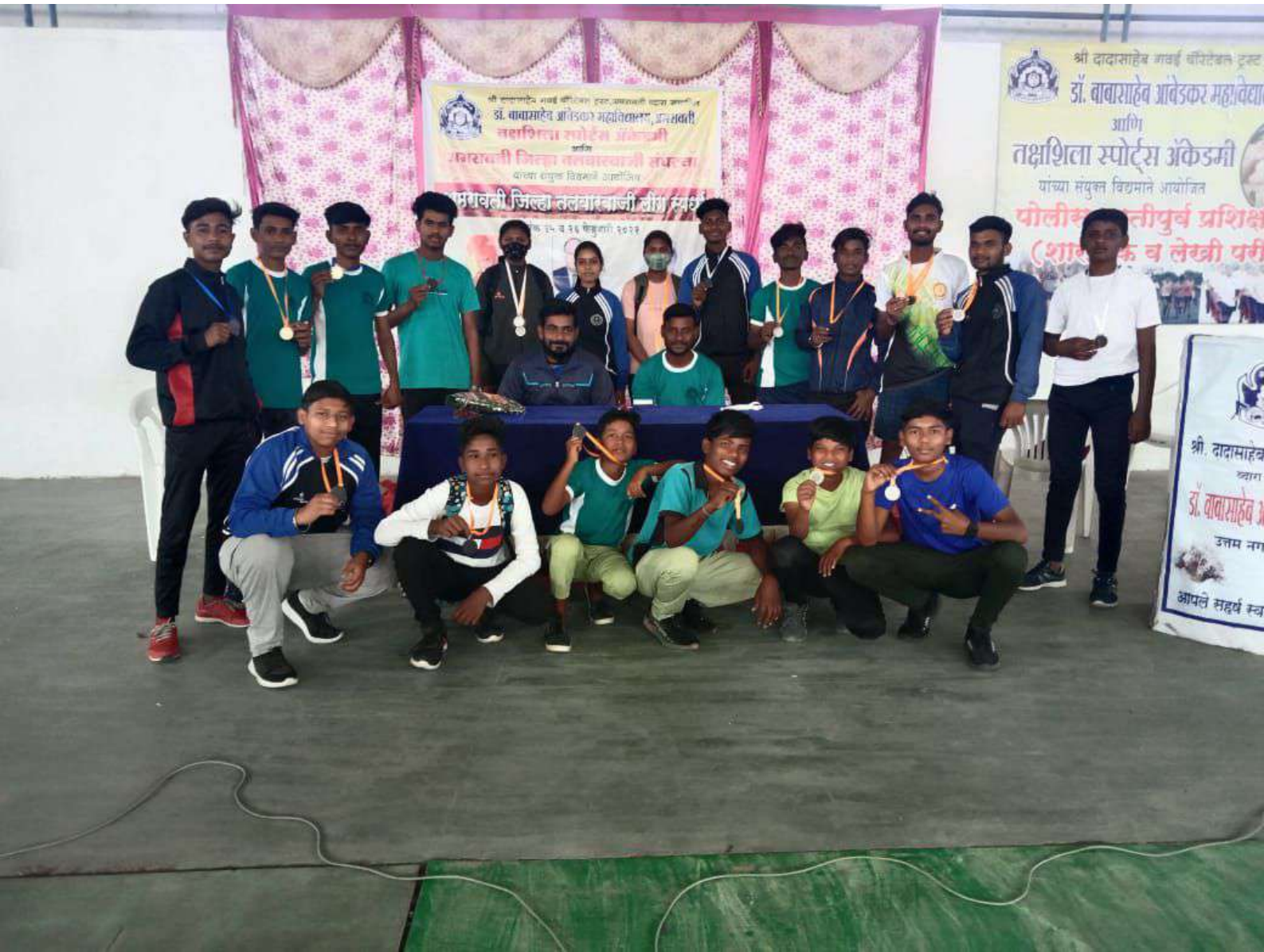
DISTRICT LEAGUE FENCING TOURNAMENT 2021-22