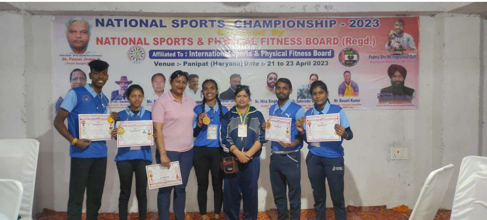
COLLEGE STUDENT IN PARTICIPATED IN NATIONAL PANIPAT ( HARIYANA) 2023-24